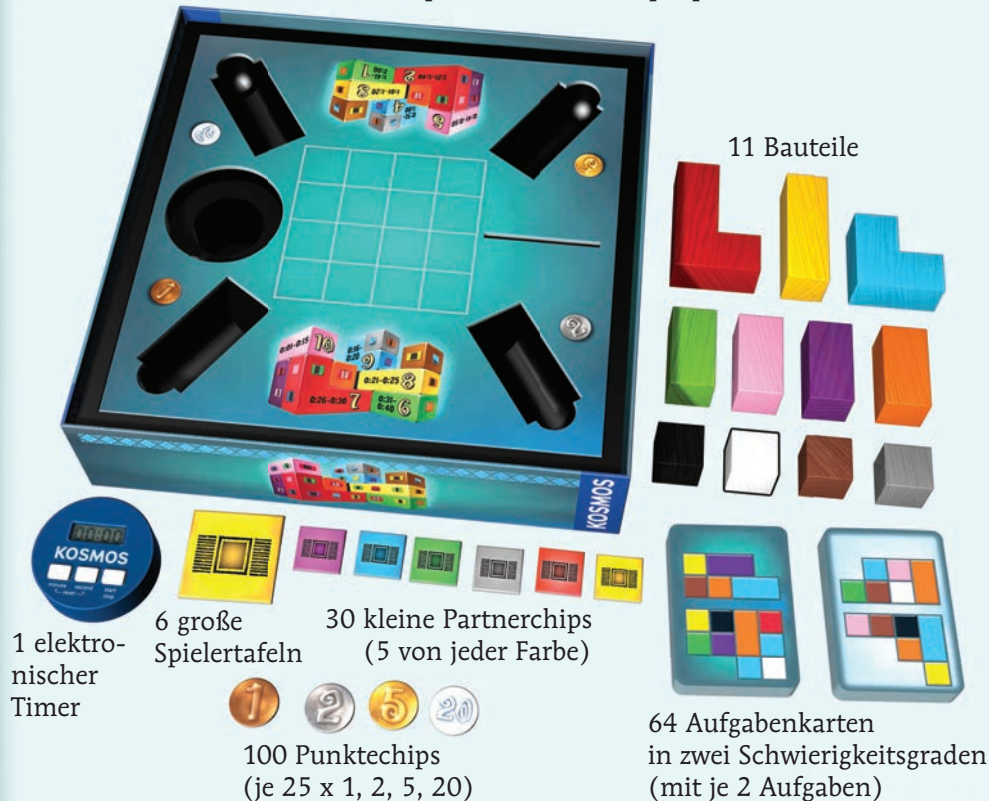
Spielschachtel mit Spielplan